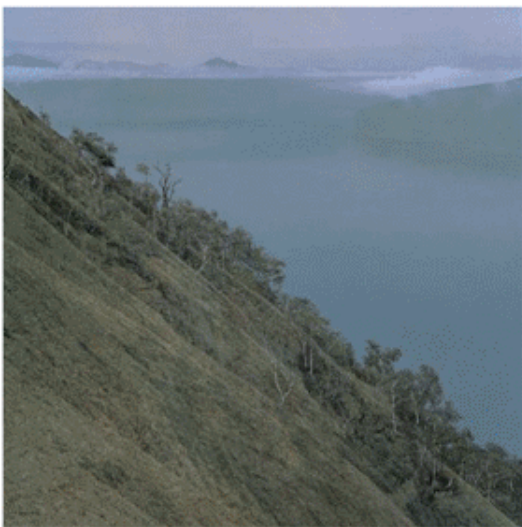
《摩周湖・霧》 ウッドワン美術館蔵