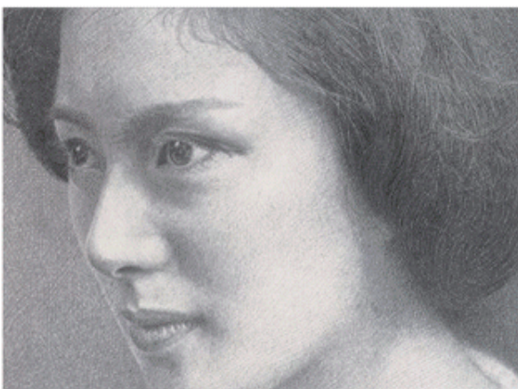
《和香子》 豊橋市美術博物館蔵