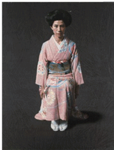
《きもの》 豊橋市美術博物館蔵