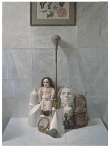
《人形のある静物》 株式会社さえら蔵