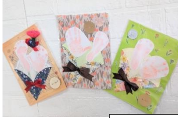
母の日♪手形足形アート