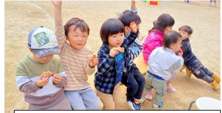
窯で焼いたピザを食べたよ！

5月から支援センターの建物が新しくなり、より快適にご利用いただけるようになります！まだ室内の作業が完了していない為、ご不便をかける場面もありますが、ご了承ください。 トイレ、ウォーターサーバーの設備はございます。 園庭でピクニックをしたり、テントを張る等しながら、初夏の訪れを一緒に楽しみましょう♪