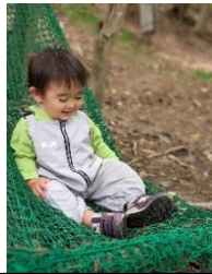
はじめましてのお友達にも たくさん会えました♪