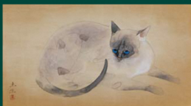
奥村土牛「猫」33.3×60cm 山陽新聞社所蔵