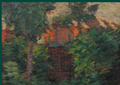
青木繁「夏の神社」21×30.3cm 黒住教宝物館所蔵