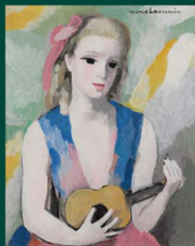
マリー・ローランサン「ギターを弾く娘」41×33cm トマト銀行所蔵