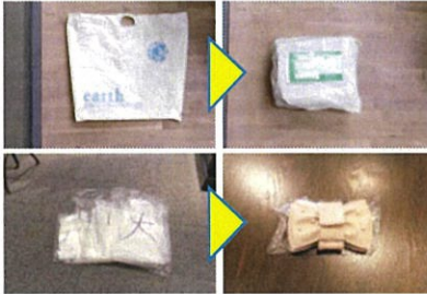
(株)スライプインターナショナル 平成29年度優秀賞

自店の使用済み商品袋などを発送用袋として再利用するとともに、商品の包装用紙を店舗間移動用袋として再利用しています。