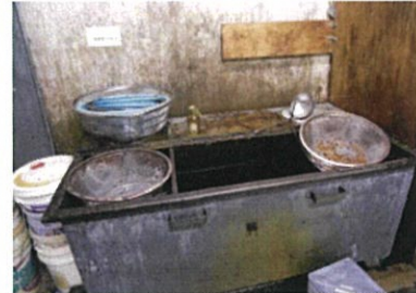
(株)ホテルグランヴィア岡山 平成26年度最優秀賞

調理工程において発生した食廃油を回収し、バイオディーゼル燃料等へ再利用しています。