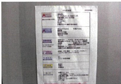
(株)エコボード 平成29年度優秀賞

再生可能な雑紙 がみ の集積場所を作り、定期的に古紙回収業者へ引き渡しています。