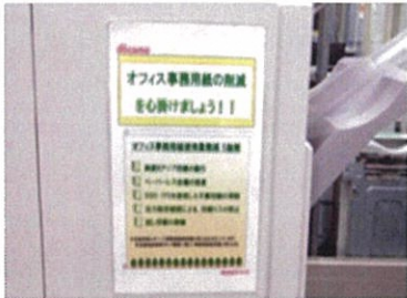
(株)ドコモCS中国 岡山支店 平成29年度最優秀賞

オフィス事務用紙の削減 5 施策の実施 (両面印刷、ペーパーレス会議、不要印刷抑制、出力設定での印刷ミス防止、試し印刷抑制)