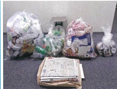
(株)ドコモCS中国 岡山支店 平成29年度最優秀賞

一つ一つの取組の積み重ねで、大きな成果が生まれます。次のページの「ごみ減量・資源化のためのチェックポイント」等を参考に、貴事業所に合った取組を始めましょう！