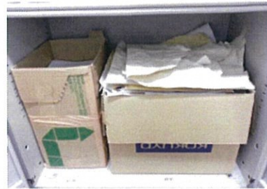
(株)リオス 平成27年度優秀賞

再生可能な雑紙 がみ の集積場所を作り、定期的に古紙回収業者へ引き渡しています。