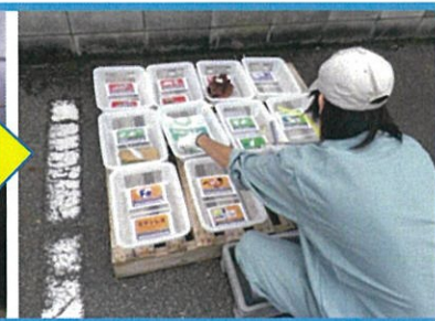
オーエム産業(株) 平成28年度最優秀賞