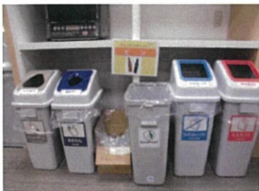
(株)ドコモCS中国 岡山支店 平成29年度最優秀賞

各分別BOXを設置し、独自の分別表を貼るなどして、社員が分別し易い工夫をしています。