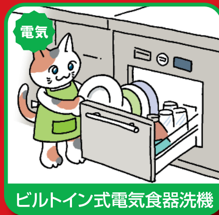
ビルトイン式電気食器洗機