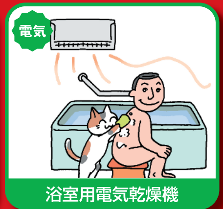
浴室用電気乾燥機