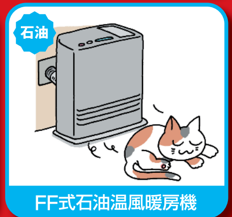
FF式石油温風暖房機