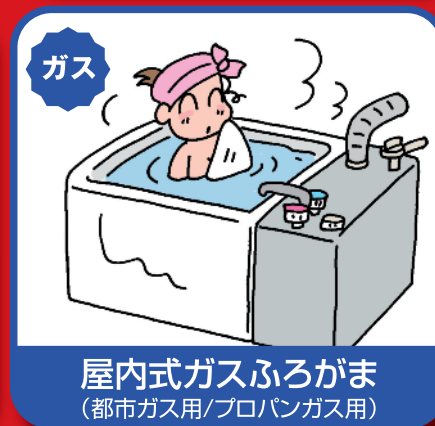
屋内式ガスふろがま (都市ガス用/プロパンガス用)

平成21年4月1日からは 現在お使いの製品*も 点検可能ですので、 詳しくはメーカーに お尋ねください。