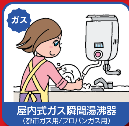
屋内式ガス瞬間湯沸器 (都市ガス用/プロパンガス用)