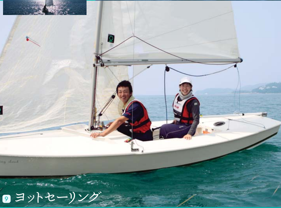
9 ヨットセーリング