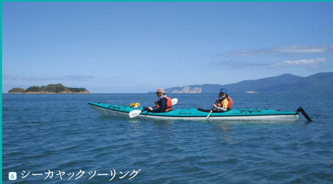
6 シーカヤックツーリング