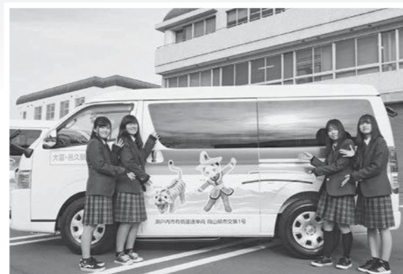
市営バスのラッピング車両とデザインした邑久高校美術部員

既存路線の車両にも、3月末までにラッピングされる予定です。新しくなった市営バスに、ぜひご乗車ください。