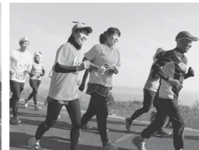
それぞれのペースで走りました