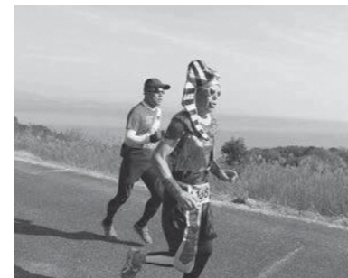
仮装しながら楽しく走るランナーも