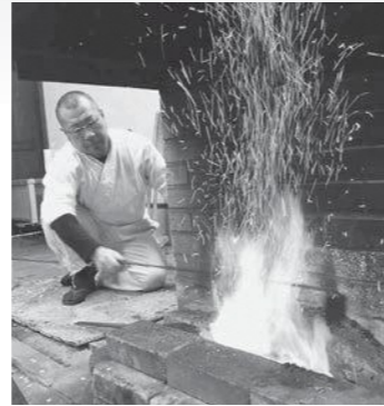
刀匠による古式鍛錬の様子