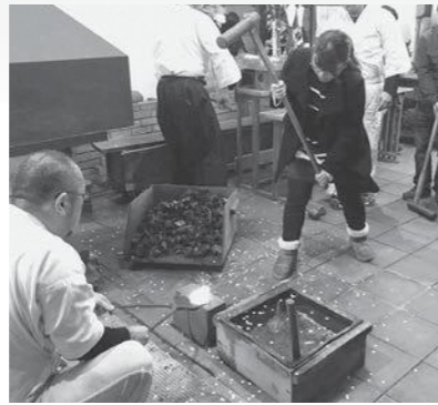
両手でしっかり槌をふるう体験鍛錬参加者

また、当日は体験鍛錬もあり、参加した見学者らは、重い槌に苦戦しながらも貴重な体験を楽しんでいました。