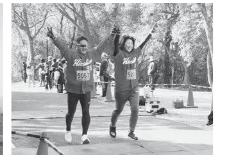
最後は笑顔でゴール!!