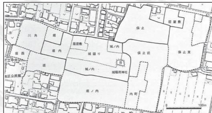
尾張城跡要図（『邑久町史考古編』より転載）