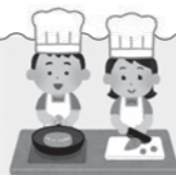
昨年の料理教室の様子