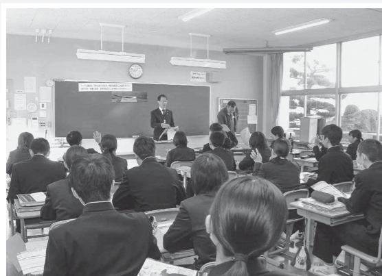
市職員の説明を真剣に聞く生徒たち

2月19日、長船中学校3年生4クラスの社会科授業（公民分野）で、「山鳥毛から地方自治・地方創生に向き合う」と題した授業が行われました。