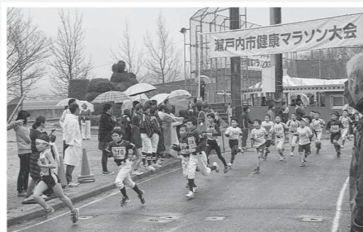
快走する小学生ランナー

また、ゴール後は、「かぼちゃの会」の皆さんが作る、地元産の野菜やカキなどがたっぷり入った「ハッスル鍋」が振る舞われました。