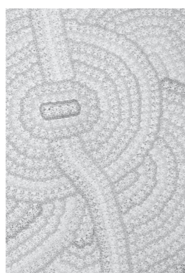
西脇直毅「無題」2016年

しかし、接近すると、その作品は緻密な猫や網目といった限定的なモチーフの反復によって表現されていることがわかります。