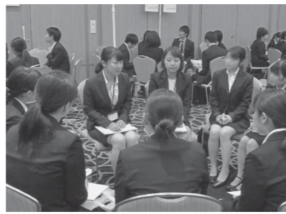
市職員(写真中央2人)の説明を聞く参加者(昨年の説明会)

瀬戸内市、備前市、赤磐市では、次のとおり職員採用合同説明会を行います。 参加費無料、事前の申し込みは不要です。面接などは行いません。普段着でお越しください。 また、合同説明会への参加の有無が選考に影響することはありません。 ▽日時 5月2日(土) 午後1時～午後4時45分 ▽場所 サンビーチOKAYAMA (岡山市北区駅前町2-3-31) ▽内容 採用試験の概要や業務内容の説明、若手職員との対話など ☎0869・22・3909