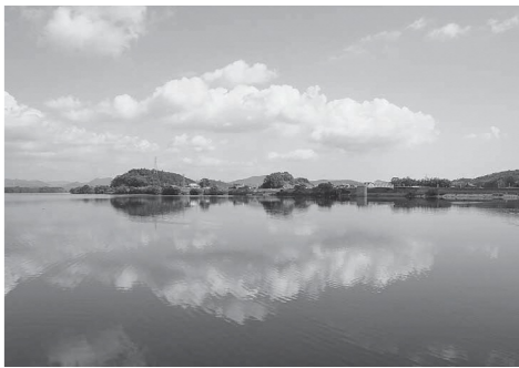
美しい水環境を守りましょう

ひとたび水質事故が発生すると、水環境の回復には膨大な労力と時間を要することになります。さらに、事故対応にかかった費用は原因者が負