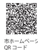
市ホームページ QRコード

詳しくは、市ホームページをご覧ください。 国税課 ☎0869-22-2464、1114 HP http://www.city.setouchi.lg.jp/