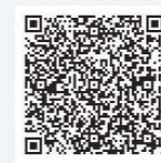
市ホームページQRコード

▽児童手当支援課 0869-26-5947 HP http://city.setouchi.lg.jp/