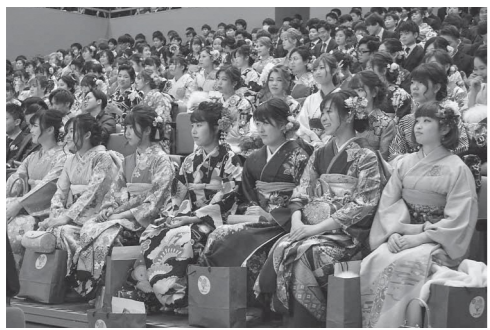
令和2年成人式の様子

※住民票が市外にある人でも対象期間に生まれ、市内または市外の中学校卒業時に瀬戸内市に住民票があった人は参加できます。参加を希望する場合は、事前にご連絡ください。