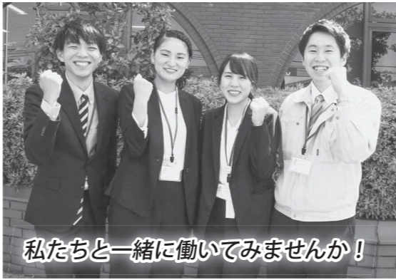
私たちと一緒に働いてみませんか!

※受験案内などを郵送で請求する場合、封筒の表に「市役所採用試験受験願書請求 図書館司書希望」と朱書きし、宛名を明記したA4サイズ