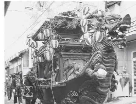
勇壮なだんじりが練り歩く秋祭り

通り沿いには、朝鮮通信使にまつわる本蓮寺や御茶屋跡をはじめ、白壁の土蔵、格子戸、燈籠堂跡など、伝統的な建造物や史跡が点在しています。古い町並みから階段を登ると、牛窓の海と町並みが一望できる牛窓天神社があります。菅原道真公が立ち寄ったとして歌碑が置かれており、「日本の夕陽百選」の鑑賞スポットとしても知られています。