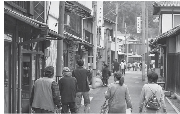
懐かしさを感じる しおまち唐琴通り

牛窓地域東部（関町、東町）、海沿いの道からひとつ路地裏に入ると、まるで昭和にタイムスリップしたかのようなレトロな町並みが広がる「しおまち唐琴通り」があります。