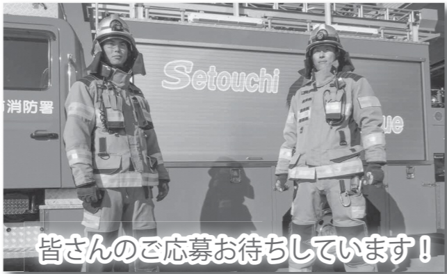
皆様のご応募お待ちしております!