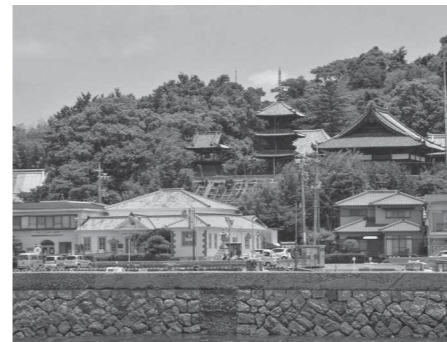
海から見た本蓮寺と牛窓海遊文化館

れ、今は朝鮮通信使の資料や船形だんじりなどを展示しています。また、大正4年に牛窓銀行本店として建てられ、その後昭和55年まで旧中国銀行牛窓支店として使われた街角ミュージゼ牛窓文化館（どちらも国の登録有形文化財）では、文化交流が盛んだった往時の牛窓の歴史を感じることもできます。さらに、八朔のひなかざりに供えるしこまや勇壮など、伝統的な民俗文化も地域に受け継がれています。皆さんもぜひ、「しおまち唐琴通り」を歩いて牛窓の歴史に出会ってみてください。