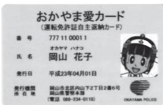
おかやま愛カード(見本)