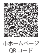
市ホームページQRコード