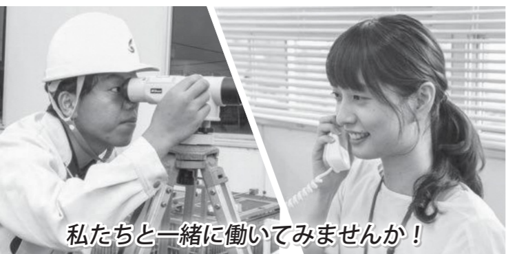
私たちと一緒に働いてみませんか!

役所採用試験受験願書請求 ●希望」と朱書きし、宛名を明記したA4サイズの返信用封筒(120円切手を貼付)を同封して、総務課へ送付してください(●は、「一般事務職」または「土木技術職」)。 問申建設課 〒701-4292 瀬戸内市邑久町尾張300-1 ☎0869-22-3909 HP http://www.city.setouchi.jp/