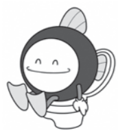
下水道マスコットキャラクター「スイスイ」

市内を流れる河川の水質改善など、市の良好な環境を守っていくため、ご協力をお願いします。