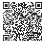
備前長船刀剣博物館 ホームページ

HP http://www.city.setouchi.lg.jp/token/