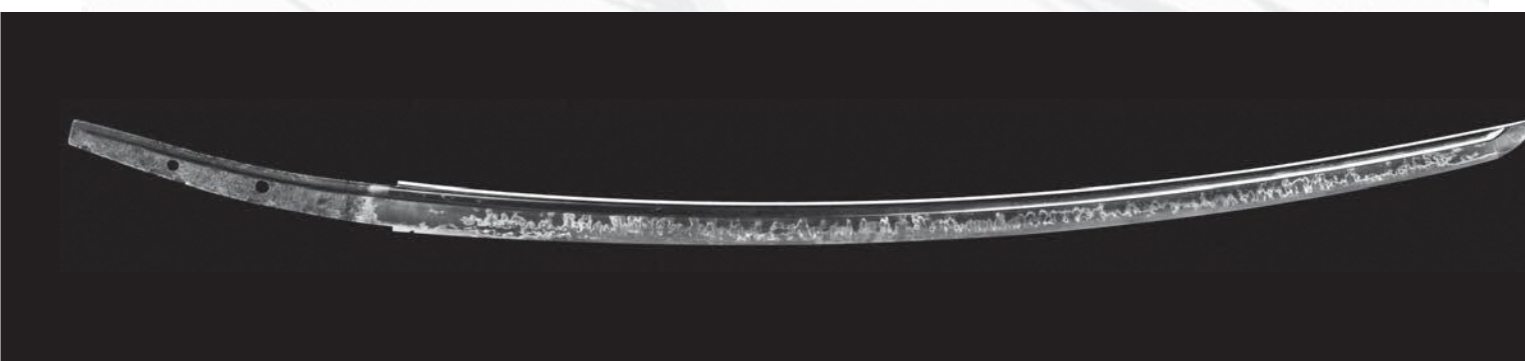
国宝「太刀 無銘一文字(山鳥毛)」