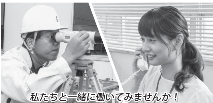
私たちと一緒に働いてみませんか!