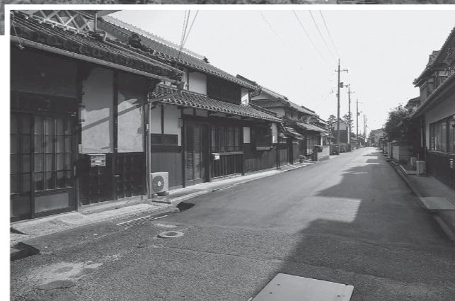
田園風景の中に、落ち着いた町屋の風情を残す通りが広がる