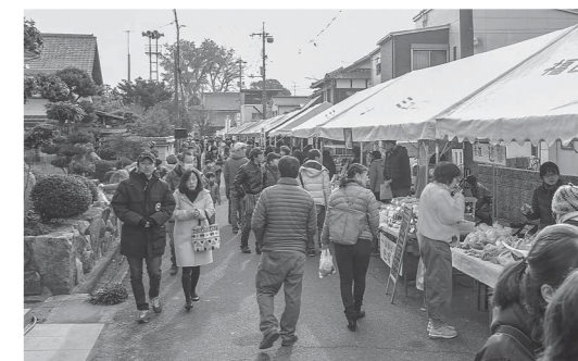
年2回開催される福岡の大手は、たくさんの人で賑わう