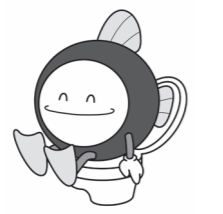
下水道マスコットキャラクター「スイスイ」

下水道への接続は、下水道が使えるようになってから、くみ取り便所の場合は3年以内、浄化槽の場合は遅滞なく接続することが、下水道法で義務付けられています。 市内を流れる河川の水質改善など、市の良好な環境を守っていくため、ご協力をお願いします。 国民健康課 ☎0869-22-5151