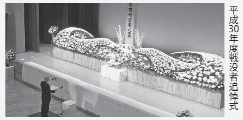
平成30年度戦没者追悼式

市では、令和元年度戦没者追悼式を次のとおり開催します。 戦没者の御霊に対し、謹んで哀悼の誠を捧げ、ご遺族の皆さんのご労苦に対し心からの敬意を表したいと考えています。 ご遺族の皆さんの出席をお願いします。 ▷日時 11月1日(金) 午前10時～ ▷場所 ゆめトピア長船 国民健康課 ☎0869-26-5941