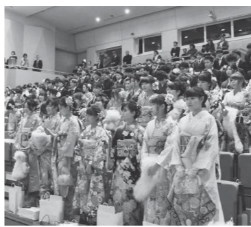
平成31年瀬戸内市成人式の様子