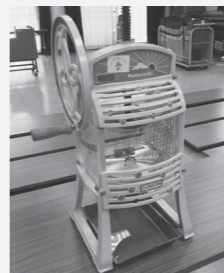
夏祭りなどで活用されるかき水器

コミュニティ助成事業は一般財団法人自治総合センターが、宝くじの社会貢献広報事業として、コミュニティ組織の行う地域の連帯感に基づく自治意識を盛り上げる事業を対象に助成を行うもので、宝くじの受託事業収入を財源としています。