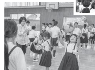
ボールを受け取る前に、手をたたくなどの動作を入れたキャッチボール