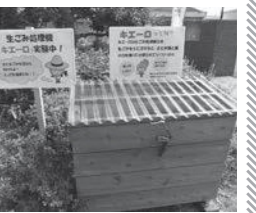
市役所でキエーロの実証実験中

●設置場所（日当たり、風通しの良い場所）を確保できる人 ※キエーロ講習会は9月3日（火）14時から市役所本庁で開催します。 ※講習会の当日にキエーロを貸与します。クリーン・ユーキの土（10キログラム）も一緒にお渡しします。 ※希望者には、モニター期間終了後にキエーロを差し上げます。 ▷応募方法 市役所1階の生活環境課窓口に設置している応募用紙に記入し、提出してください。 問 生活環境課 ☎0869-22-1899