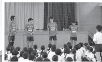
4人のコーチに普段聞けない質問をする児童