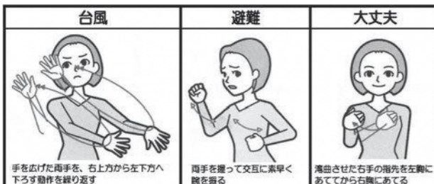
全日本ろうあ連盟発行『わたしたちの手話 学習辞典1』

無料調停手続き相談会 調停手続きの利用に関する相談会が無料で開催されます(申し込みは不要)。 お気軽にご相談ください。 ▽日時 9月18日(水) 午前10時～午後3時 ▽場所 岡山県総合福祉・ボランティア・NPO会館(きらめきプラザ) (岡山市北区南方2-13-1) ▽相談内容 【民事】金銭貸借、土地、建物、交通事故、公害など 【家事】離婚、親権、養育費、年金分割、相続など ▽岡山県家庭裁判所総務課 086-222-6771