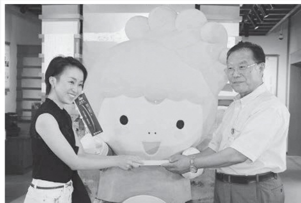
館長から小刀を笑顔で受け取る入館者

昭和58年に前身である備前長船博物館が開館して36年目の今年、7月30日に備前長船刀剣博物館の入館者数が100万人を突破しました。