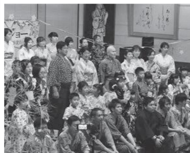
全員で「宵待草」を合唱