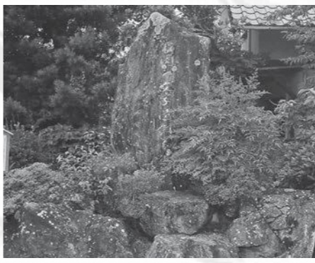
福岡地区(妙興寺の西)にある「福岡一文字造剣之地碑」

一文字派は、山鳥毛に代表される豪華絢爛な「丁子乱れ」と呼ばれる刃文を得意とし、鎌倉時代には絶頂を極めました。