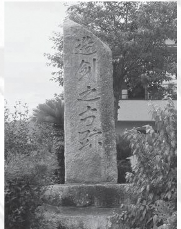
長船地区(慈眼院の東)にある「造剣之古跡碑」

このように、福岡地区や長船地区では、長い歴史の中で多くの刀工たちが日本刀の製作に勤しんでいました。