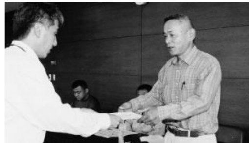
委嘱状を受け取る不法投棄監視員(右)

ける障害者割引制度適応の人 ▽手続き等 ①市福祉課で「ETC車載器購入助成申込書」と「申込書送付用封筒」を受け取り、記入後、80円切手を添付の上、郵送してください。 ②申し込み後2カ月程度で日本郵政公社東京貯金事務センターから「郵便振替払出書」が郵送されますので、最寄りの郵便局で助成金を受け取ってください。 ■問い合わせ・申込先 (財)道路サービス機構 (平日午前9時～午後5時30分) ☎03-54458-5569 市福祉課 ☎0869-26-5943