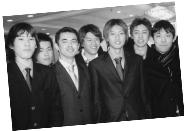
恩師を囲んで記念撮影（邑久会場）