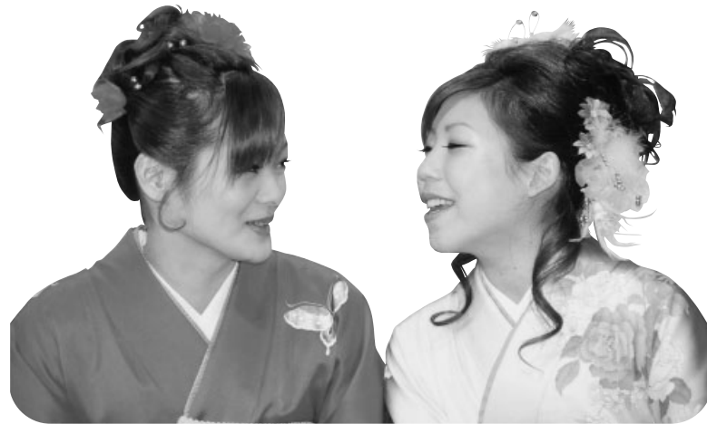
「久しぶりねえ」と会話も弾みます（邑久会場）