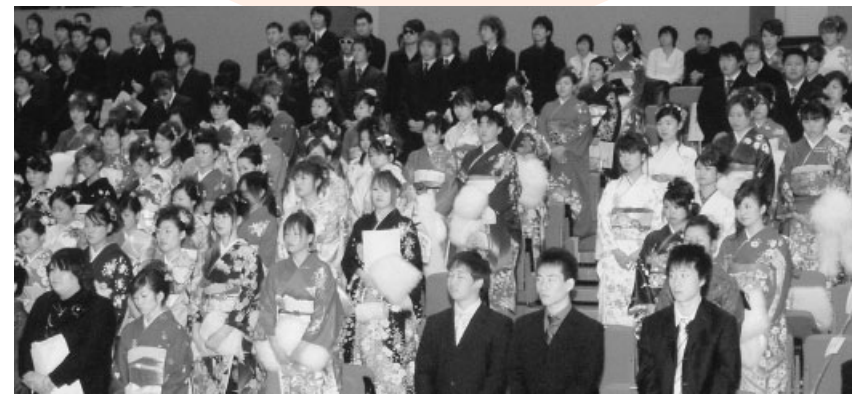
式に参列する新成人の皆さん（長船会場）