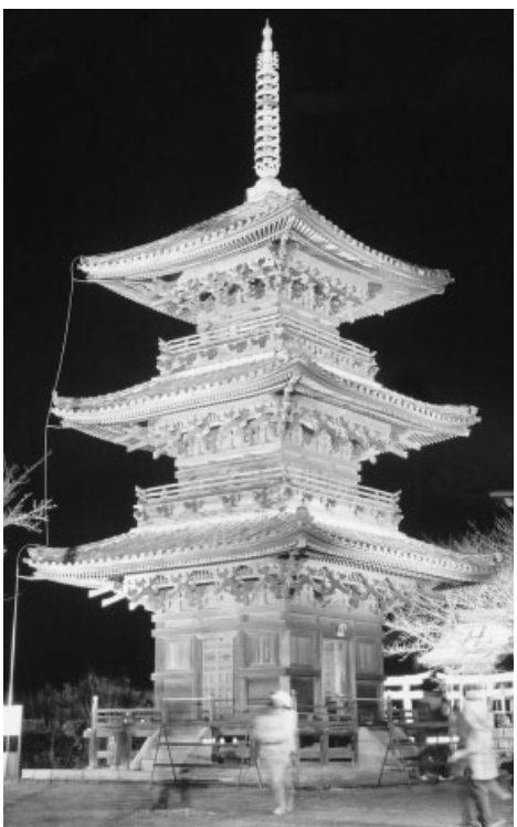
ライトアップされ、光り輝く餘慶寺三重塔

上寺を良くする会が12月31日、上寺山境内(邑久町北島)のライトアップ、大根たき、甘酒の無料接待、スタンプリリーなどを催しました。