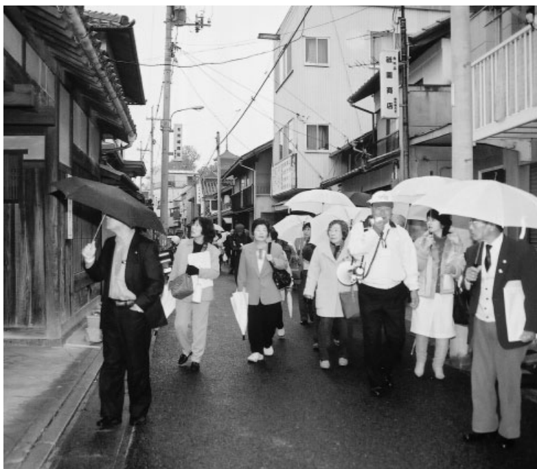
牛窓町観光ボランティア活動チームの皆さんが、県内の観光ボランティアガイドの皆さんを案内(しおまち唐琴通り)

代表)の皆さんから説明を受け、しおまち唐琴通りや本蓮寺などを回りました。観光ボランティア活動チームの皆さんは、視察や研修時など、地元のおもちゃ話を知る水先案内人として活躍しています。