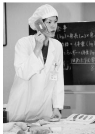
管理栄養士が食事療法について講義

市立邑久病院では、次のとおり糖尿病教室を開催しています。糖尿病治療をしている人、関心がある人はぜひ、この機会に4月12日(火)で、申込期限は4月8日(金)で