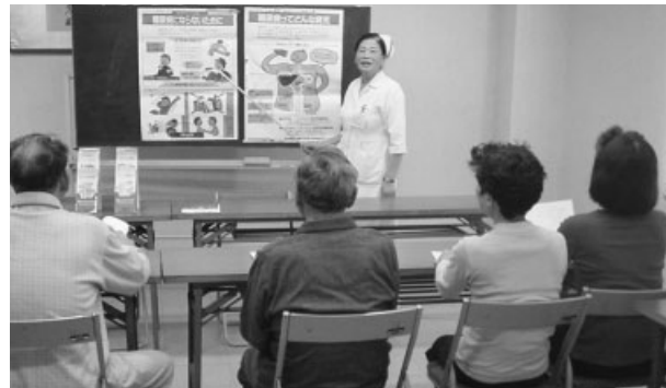
日常生活の注意点について看護師が講義

今や、糖尿病は身近な病気です。糖尿病を放置しておく、失明・脳卒中・心筋梗塞・手足のしびれを起こすことにもなります。また、人工透析を受けている患者数の第1位は、糖尿病の人という報告もあります。これらを予防するには、正しい知識と治療が必要です。