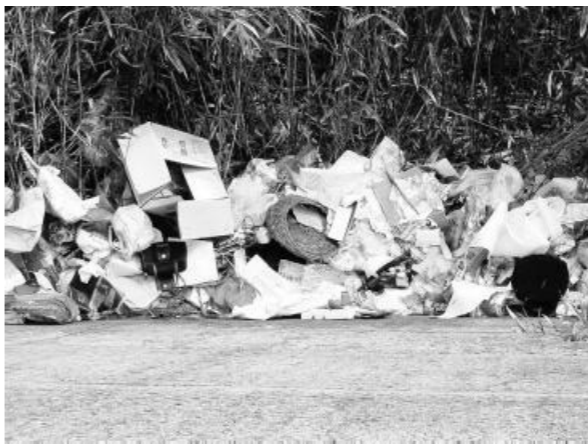
だれが見ても目を覆いたくなるような、ごみの不法投棄

わたしたちは、常に豊かな生活を追い求めています。このだれもが抱く願望が、今日の豊かで効率的な社会を築き