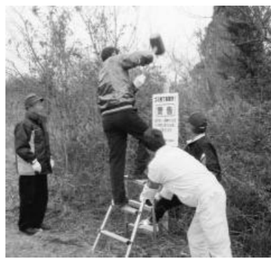
パトロールを行い警告の看板を設置

察と連携し、定期的に不法投棄のパトロールを行い、清掃や看板を設置するほか、投棄者の監視や摘発などの活動を粘り強く続けています。