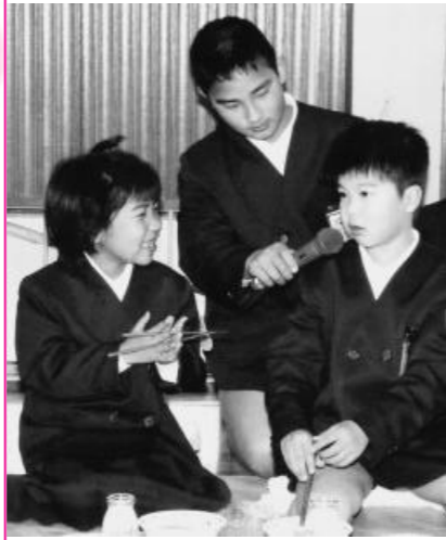
上級生が新生生にマイクを向け、 優しく質問

今城保育園で保育士として働 いています。中学生の時から保 育士になろうと決めていました。 子どもたちの成長を間近で見ら れ、すごく魅力的な仕事だと思 います。 趣味は、サッカーをすること とギターを弾くこと。ギターは、 保育にも取り入れていきます。 日々自分を高め、子どもや保 護者の皆さんに信頼される保育 士になりたいと思っています。