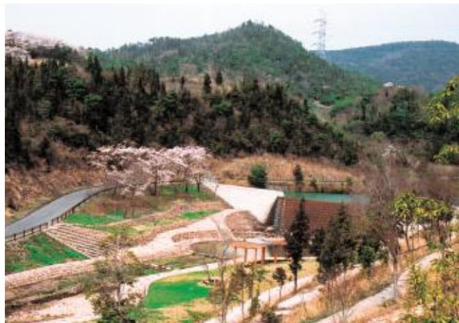
森林浴などいろいろな楽しみ方ができる長船美しい森