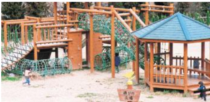
子どもたちが楽しめる遊びの広場