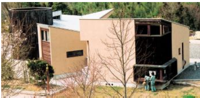
施設を管理しているビジターセンター管理棟