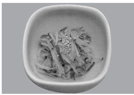
【カボチャの酢の物】