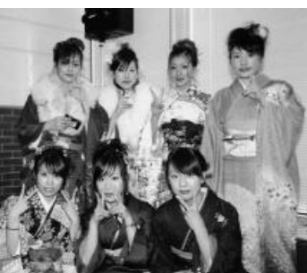
今年新成人の皆さん(邑久会場)