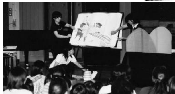
司書の皆さんがする大型紙芝居に、子どもたちは夢中で

人の親子連れが参加し ました。 パネルシアターや大 型紙芝居、パープサー ト、ブラックパネルシ アターなど、子どもた ちはお話も興味し んしんで、絵本の世界 に引き込まれ熱心に見 入っていました。