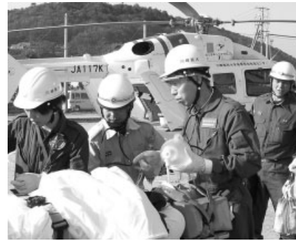
昨年の防災訓練の様子