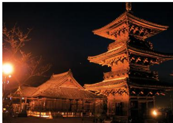
ライトアップされた餘慶寺本堂(左)と三重塔