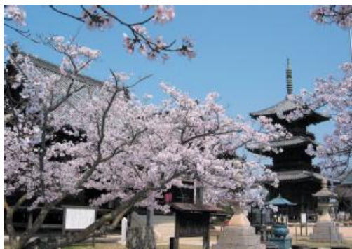
桜の名所としても知られる餘慶寺