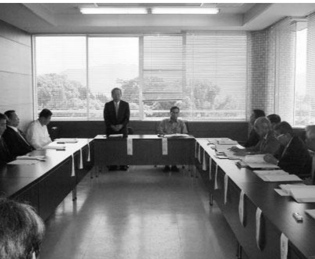
病院や診療所の今後のあり方の検討を重ねる市立病院等運営審議会

瀬戸内市では、市立病院等運営審議会を設置し、大学教授をはじめ議会・医師会・国保運営協議会・学識経験者・経営診断士の皆さん10人に委員を委嘱し、病院や診療所の今後のあり方の検討を重ねてもらっています。