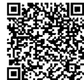
携帯電話用QRコード

あらかじめ、市のホームページ内の登録サイトから送信希望先のメールアドレスを登録するか、QRコードの読み取りが可能な携帯電話を持っていない人は、次の画像からも登録できます。