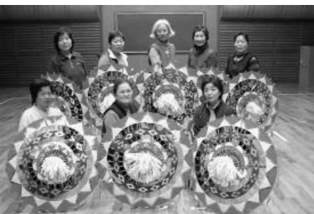
発表時には衣装もばっちりそろえます

牛窓町公民館長浜分館から、ジャンシャンと鈴の音が、軽快に聞こえます。傘踊りあじさいの皆さんが、傘踊りの練習に励んでいます。"きよしのドドンパ"、下津井おどり"などの曲に合わせて、傘を上げたり下ろしたり、くるくる回転したりと、皆さん息がそろいます。同会は、平成7年に発足し、現在は会員10人。文化祭や牛鬼まつり、夏祭りあじさいで、踊りを披露します。発表の時は、曲に合わせて衣装も作るほど熱心な皆さん。"新しい曲の動作を覚えるのは、難しいけど、みんなの踊りが、ばっちり決まったときは、気持ちいい。見た人に、