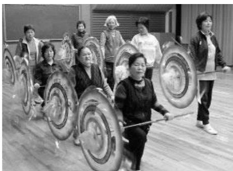
息を合わせて練習に励みます

牛窓町公民館長浜分館から、ジャンシャンと鈴の音が、軽快に聞こえます。傘踊りあじさいの皆さんが、傘踊りの練習に励んでいます。"きよしのドドンパ"、下津井おどり"などの曲に合わせて、傘を上げたり下ろしたり、くるくる回転したりと、皆さん息がそろいます。同会は、平成7年に発足し、現在は会員10人。文化祭や牛鬼まつり、夏祭りあじさいで、踊りを披露します。発表の時は、曲に合わせて衣装も作るほど熱心な皆さん。"新しい曲の動作を覚えるのは、難しいけど、みんなの踊りが、ばっちり決まったときは、気持ちいい。見た人に、