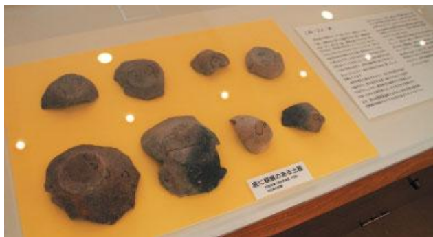
貝塚から出土した土器などは邑久郷土資料館に展示されています