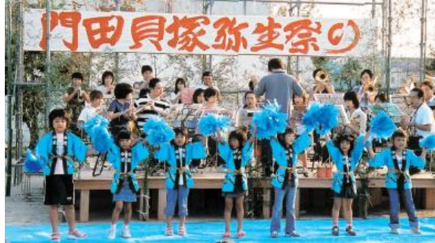
大勢の人でにぎわう弥生祭り