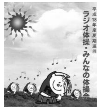
平成18年度夏期巡回ラジオ体操・みんなの体操会 8月19日、邑久スポーツ公園野球場でみんなと一緒にラジオ体操をしましょう

この様子は、NHKラジオ第1で午前6時30分から全国生放送します。ラジオ体操を通しての体力づくりや健康づくりを推進するとともに、瀬戸内市を全国に発信する絶好の機会ととらえ、できるだけ多くの市民の皆さんに参加してもらえよう、みんなの体操会の成功に向けて、ご支援ご協力をお願いします。