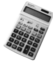
国民健康保険税の税率