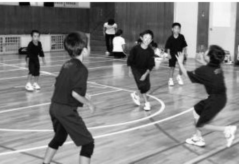
懸命にボールを追いかけます