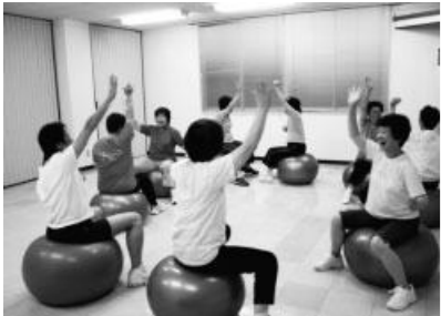
ゲームを取り入れ「ジャンケンポン」