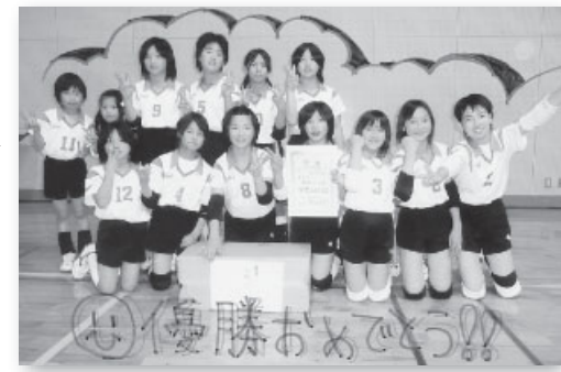
あなたも楽しい団の活動をやってみませんか?

スポーツ少年団の大会になると、瀬戸内市にある「瀬戸内シーガルズ」というチームで出場します。このチームは、「裳掛スポーツ」と「牛窓スポーツ」との3団で協力して作るチームで、他団との交流を含めて、元気で活発なチームの運営を目指しています。練習日は、水・土・日曜日で、国府小学校や市民体育館を中心に活動しています。 ■問い合わせ先 育成会会長 関さん ☎ 0869-26-5536