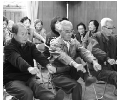
生活に適度な運動を取り入れて、いつまでも健やかに過ごしましょう