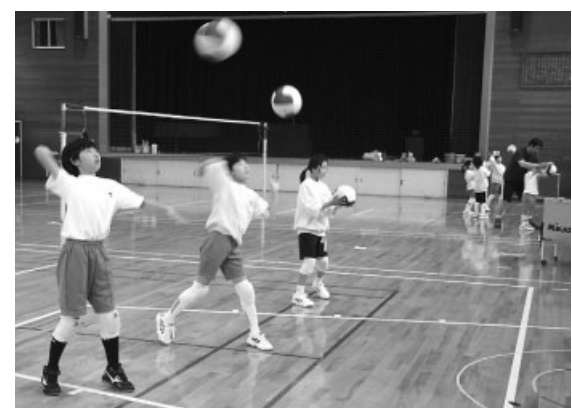
どの施設も留意事項を守って利用しましょう

■問い合わせ先 市社会教育課 ☎0869-34-5605 牛窓体育館・牛窓グラウンド ☎0869-34-5663 邑久スポーツ公園 ☎0869-22-2211 邑久B&G海洋センター ☎0869-22-2211 長船スポーツ公園 ☎0869-26-4538