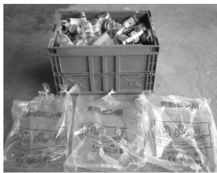
カン・ビン・金属類のコンテナ回収にご協力をお願いします

準備が整い次第、市広報紙、地元説明会などで、順次お知らせしていきますので、市民の皆さんのご理解、ご協力をお願いします。