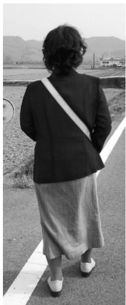
夜間の外出時には夜光タスキを忘れずに