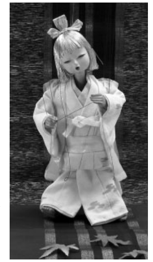
喜之助人形「雪ん子」

彼の代表作である雪ん子は、現在、モニュメントとして瀬戸内市の玄関口であるJR赤穂線邑久駅前に設置され、本市を訪れる多くの観光客を出迎えています。