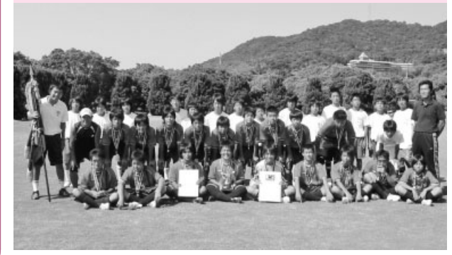
中学校総合体育大会で優勝した長船中サッカー部の皆さん