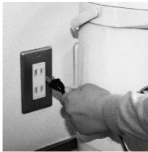
長時間使用しないときは、コンセントからプラグを抜きましょう。

ものを詰め込みすぎないよう整理整頓しましょう。電気ポットなどの電気製品を長時間使わないときは、コンセントからプラグを抜くようにしましょう。煮物などの下ごしらえは電子レンジを活用しましょう。