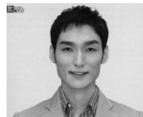
2011年7月24日までにアナログ放送は終了します。