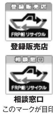
このマークが目印