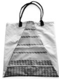
傘をマイバッグにリメイク!