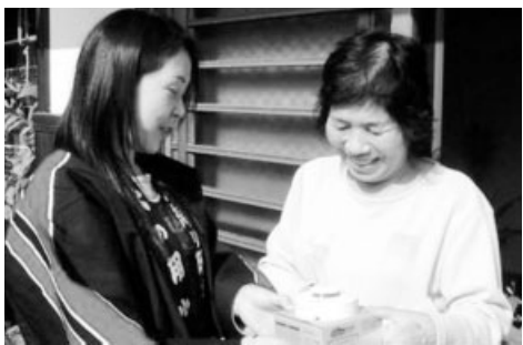
火災警報器を配布する婦人防火クラブの皆さん

11月6日、瀬戸内市少年婦人防火委員会に全国消防機器協会から「社会貢献事業」として住宅用火災警報器100個と消火器20本が贈られました。これらの機器は、秋季全国火災予防運動を前に、知尾、鍛冶谷、間口前泊地区の婦人防火クラブなどを通して、11月8日に、福谷地区内の高齢者のみの世帯に対して配布されました。