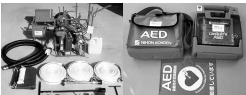
支給された軽可搬ポンプとAED

この事業には、宝くじの助成金が含まれており、婦人防火クラブの育成強化を図るため、同協会からの助成により「自分たちのま