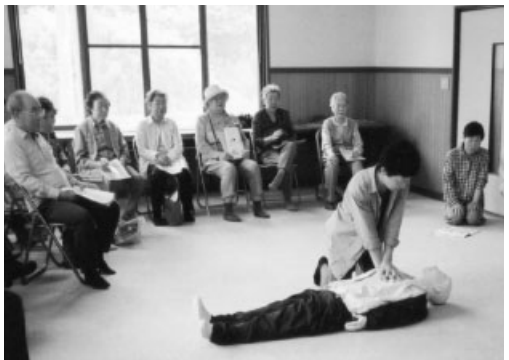
心肺蘇生法を学ぶ千手婦人消防隊の皆さん