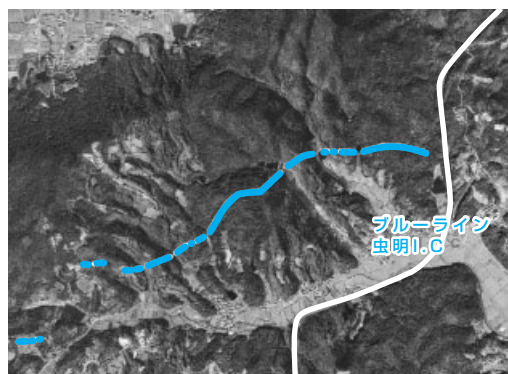
福谷地区のしし垣分布図

【参考文献】 河崎恭一『瀬戸内市邑久町福谷猪垣の調査』 植松岩實『龍ノ口山に於ける「猪垣」の検証』