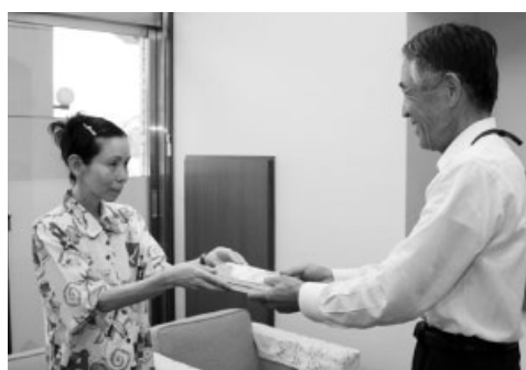
日下教育長に本を手渡すはないさん（左）

「赤い月・青い月」は、月からやって来たウサギが人間に姿を変え地球の女の子と恋に落ちるといふファンタジー。備前市伊部の備