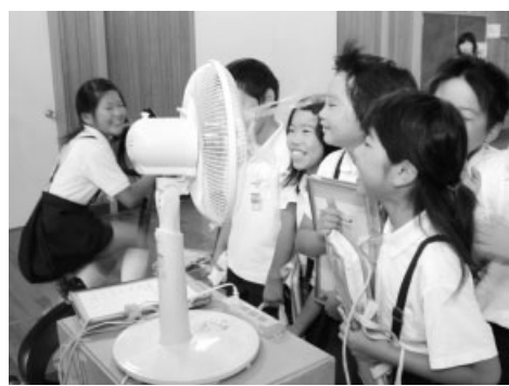
「涼しい〜」でも発電自転車をこぐのは大変！

この教室は、おかやまエコマインドネットワークの主催で行われ、「ストップ！地球温暖化！省エネと自然エネルギーを体験してみよう」をテーマに講義やささまざまな実験を通して地球温暖化や省エネについて学習するものです。