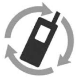
モバイル・リサイクルネットワークのマーク