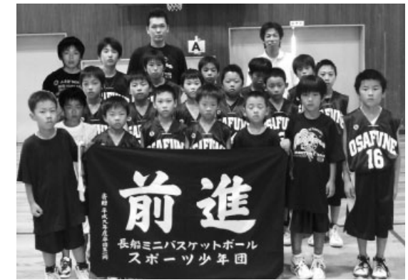
夢に向かって前進あるのみ! 長船ミニバスケットボールスポーツ少年団男子チームの皆さん

子チームは、県連盟推薦で初めて北九州市で開かれたドリムカップに出場。中国、九州の各地から集まった16チームの強豪を相手に善戦し、6位に入りました。 団員は、さらなる飛躍を胸に誓い、来春の全国大会出場が懸かる11月の県選手権大会に向けて練習に励んでいます。 バスケット好きな人、一緒に始めてみませんか? ただいま団員募集中です!