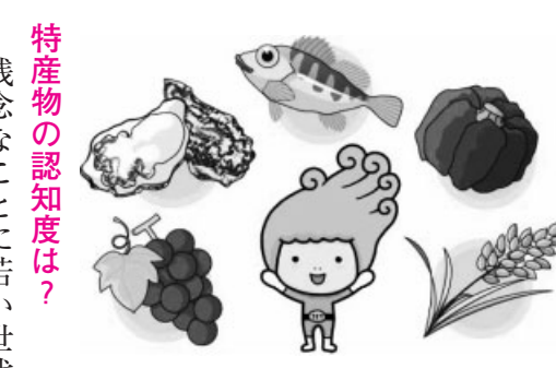
特産物カレンダーを参考に、地元で取れる旬の美味しい食材を味わいましょう

季節を問わず、欲しい食材が手に入る現代の私たちは、「旬」を感じるものが少なくなってきたいます。 その点、本市は住宅地のすぐ近くにも農地が広がり、庭や畑で家庭菜園を楽しむ人も多く、普段から季節を感じやすい環境にあるといえます。 また、農業や漁業が盛んなことから、特産物も多く、地元の特産物や新鮮な食材が、近くの直売所やスーパーなどで容易に手に入ります。