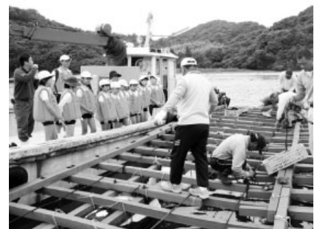
ロープを丁寧に筏につるしていきます