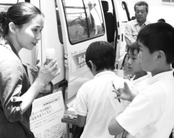
BDF車を前に講師の説明を熱心に聞く生徒たち

地球温暖化を身近に感じる事が多くなっているこのころ。皆さんも身近なところから環境に優しい取り組みを始めてみませんか。