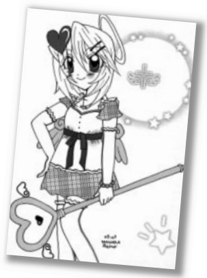
▷ペンネーム 間中零野さん