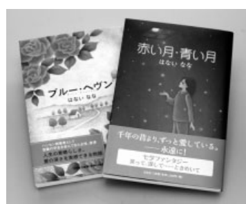
寄贈された「赤い月・青い月」と「ブルー・ヘヴン」

「赤い月・青い月」と「ブルー・ヘヴン」は、ハンセン病療養施設に住む一人の女性の目を通して描かれる患者同士の心温まる交流の物語。フィクションですが、ハンセン病への理解を深める第一歩になるのではないのでしょうか。これらの本は、市内各図書館・室に置く予定です。皆さんもぜひ読んでみてください。はないさん、ありがとうございました。