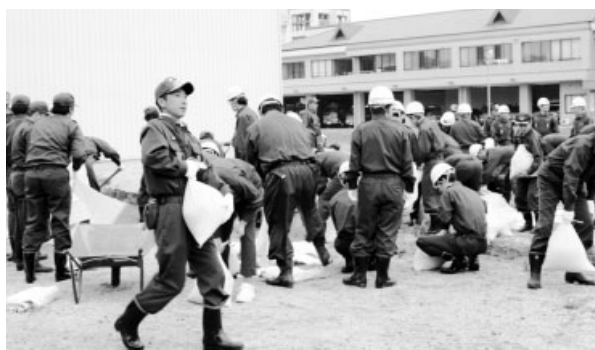
次々と土のうを作る消防団の皆さん

の土のうが必要となります。特に近年は、集中豪雨や高潮の発生率が高くなっています。消防団では、こうした機会を利用して少しでも多くの土のうを備蓄し、水害への備えを万全なものにしています。