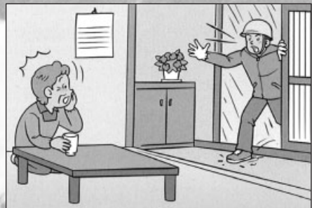
災害時には隣近所で声を掛け合って

が伝わりにくいという問題もあります。少しでも異常を感じたときには、隣近所で声を掛け合い、災害時要援護者を避難所へ誘導しましょう。また、災害時には、事故防止のため、田畑を見回ったり、屋根などの高所に上がったりしないようにしましょう。河川や海岸・岸壁など危険な個所には絶対に近づかないようにしましょう。