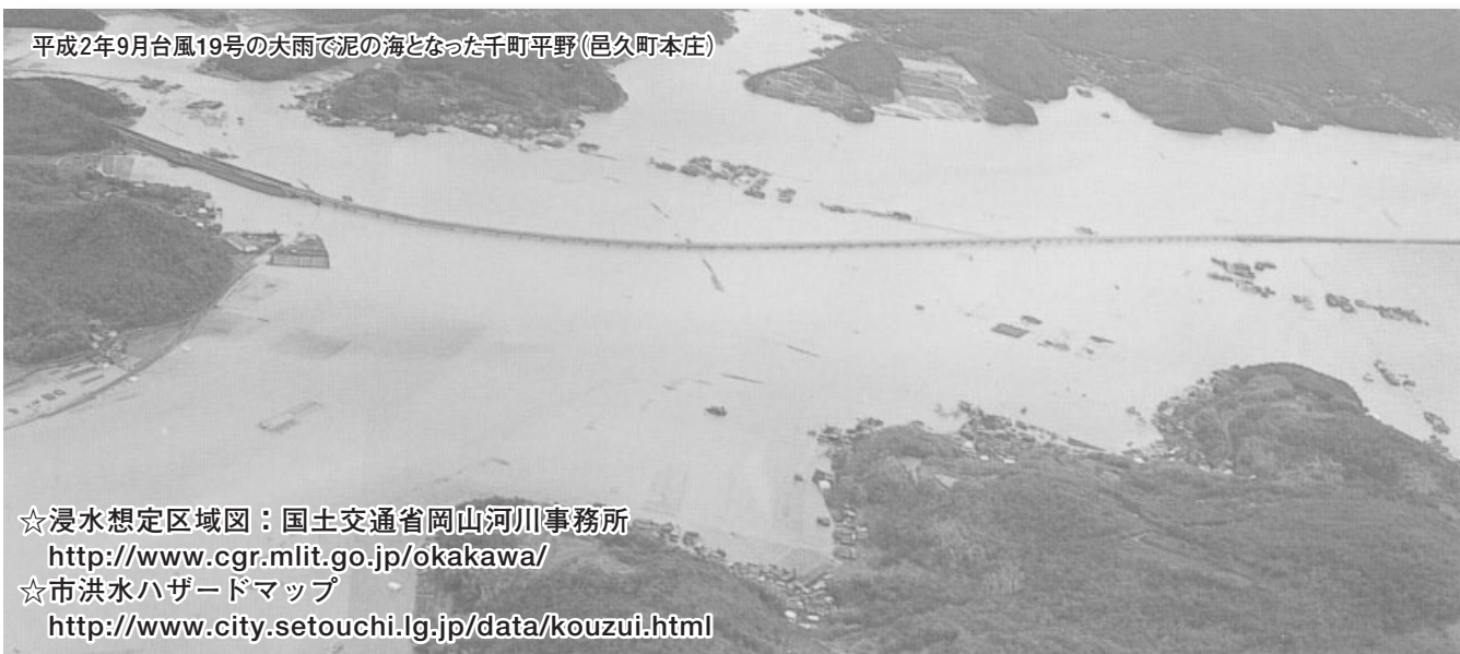
平成2年9月台風19号の大雨で泥の海となった千町平野(邑久町本庄)

浸水のスピードは非常に早く、「まだ大丈夫」と思っている場合もあります。特に「災害時要援護者」は、避難情報が出てからでは、避難行動が間に合いません。一人暮らしの高齢者などには、避難情報