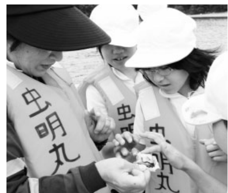
むきたてのカキを見て触って観察