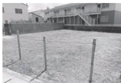
物件番号3 (旧長船交番敷地)

▽申込方法 契約管財課で申込書などを交付しますので、必要事項などを記入の上、持参または郵送で提出してください。 郵送で請求するときは、宛先明記で240円切手を貼ったA4の返信用封筒を同封して、契約管財課あてに送付してください。 ※申込期限までに入札参加の手続きが済んでいないと、