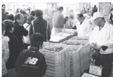
大盛況のかきの日イベント