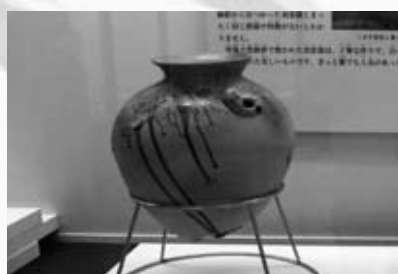
自然釉が流れた大甕

展示資料の中には、白い器の表面に緑色の自然釉が流れた大甕が設置され、寒風古窯跡群で焼かれた須恵器の特徴