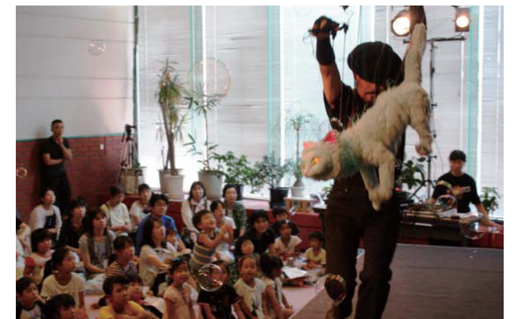
人形と一体となった動きに観客全員が魅了されたかわせみ座のマリオネットライブ

8月21、22日の2日間、中央公民館で人形劇の祭典喜之助フェスティバルが開催されました。本市出身の世界的な糸操り人形師・故竹田喜之助氏を顕彰し、地域おこしにつなげようと毎年開催されているものです。