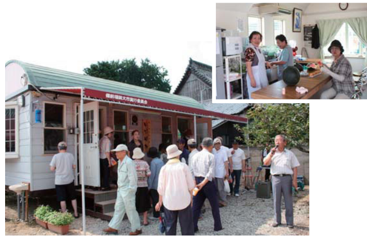
大勢の人が集まった開所式（左下）／会話に花が咲く室内（右上）

長船町福岡市場小路に「オープンハウス・いどばた」が完成し、8月1日に地域住民や関係者を集めて開所式が行われました。