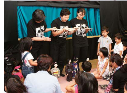
かわいい人形が勢揃いした開会式（上）／間近に見るきららの糸操りに興味津々の子どもたち（下）