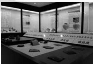
リニューアルされた展示室内

館に隣接してある国指定の史跡、寒風古窯跡群について分かりやすく学ぶことができるガイドンス室としてリニューアルされました。寒風古窯跡群は、7世紀の飛鳥時代を中心に約百年にわ