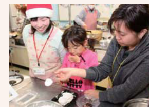
ケーキづくりは毎年大人気！

※コーナーによっては、定員(先着順)があります。なお、受け付けは当日のみ行います。